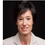
Ruth Humbel Nationalrätin